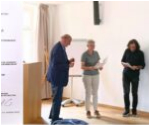
recibiendo el Honor de SCIAS Fellow cuando estuvo ermana de Ciencias en la Julius-Maximilians Univer