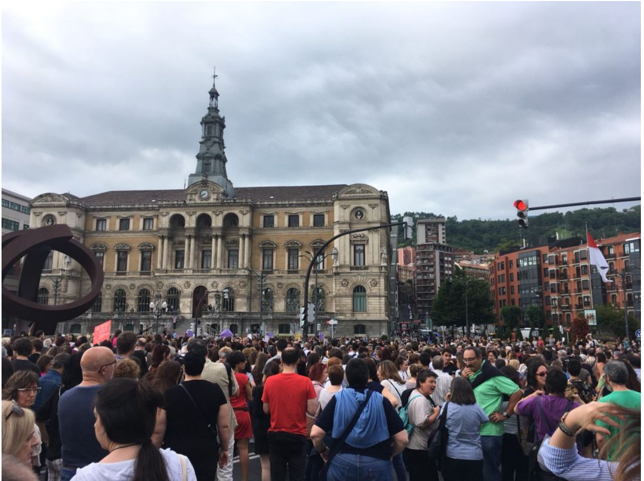
Bilbao, 22 de junio 2018