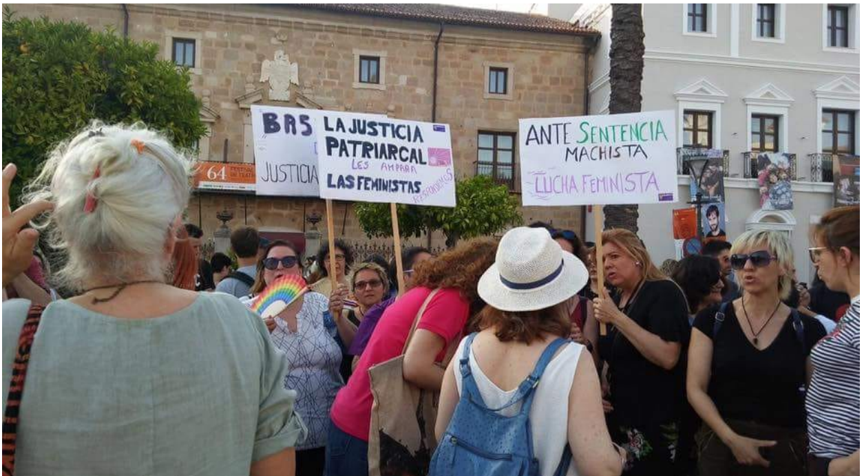
Mérida, 22 de junio 2018