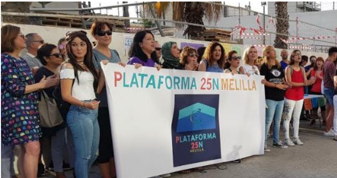
Melilla, 22 de junio 2018