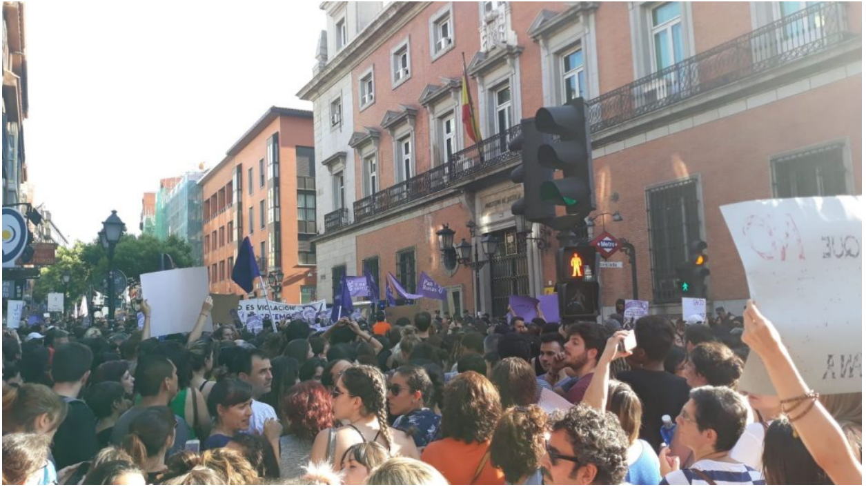
Madrid 22 de junio 2018