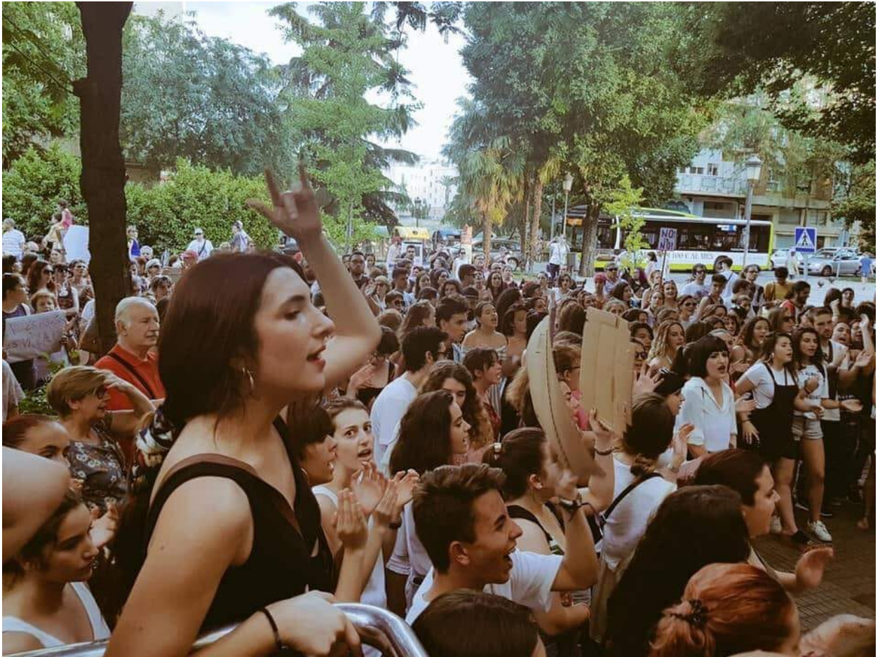
Badajoz, 22 de junio 2018