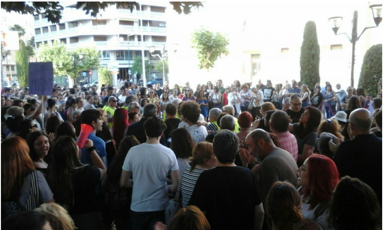
Castelló, 22 de junio 2018