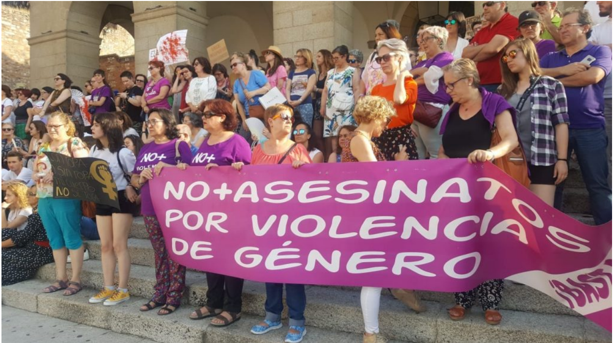
Cáceres, 22 de junio 2018