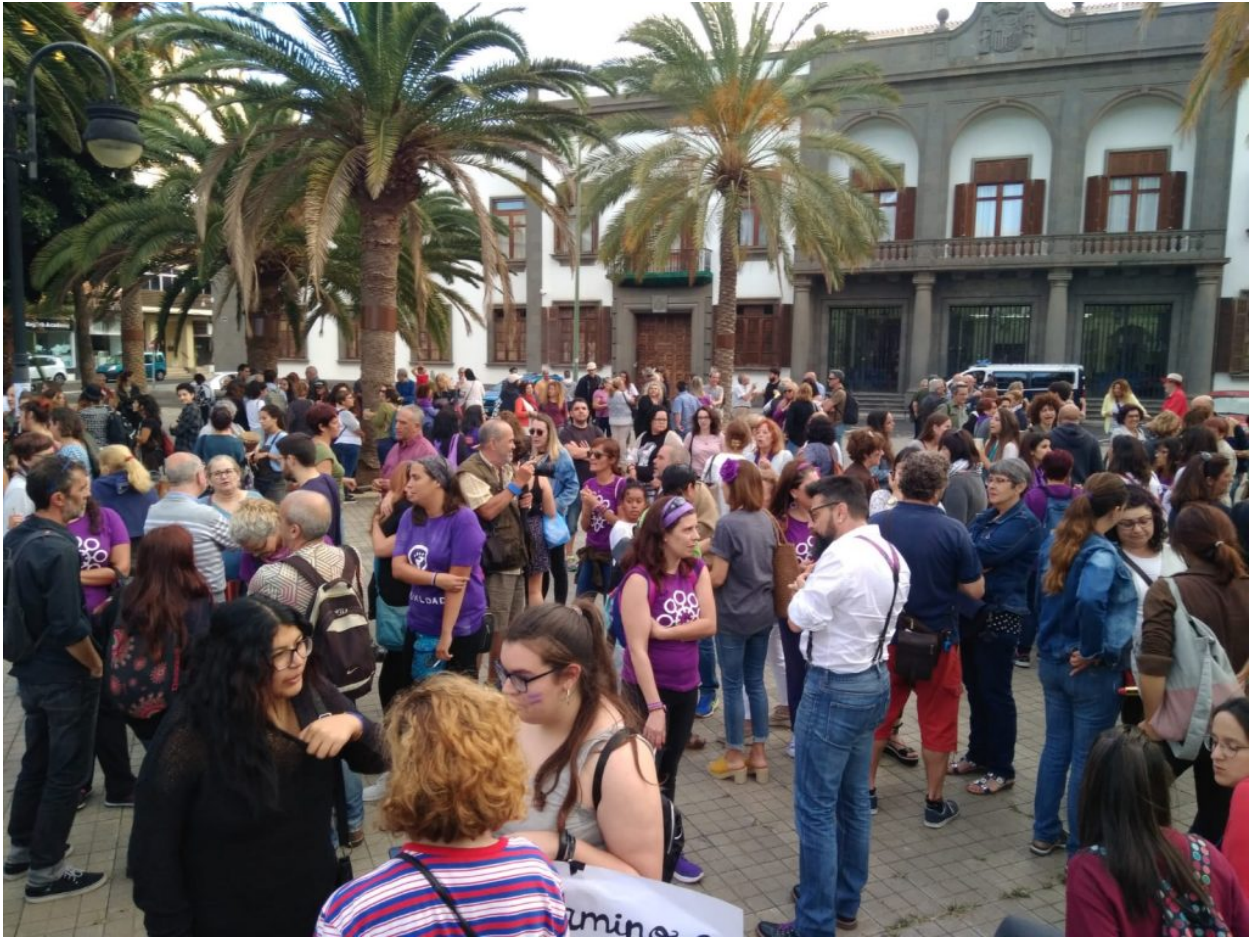
Gran Canarias, 22 de junio 2018