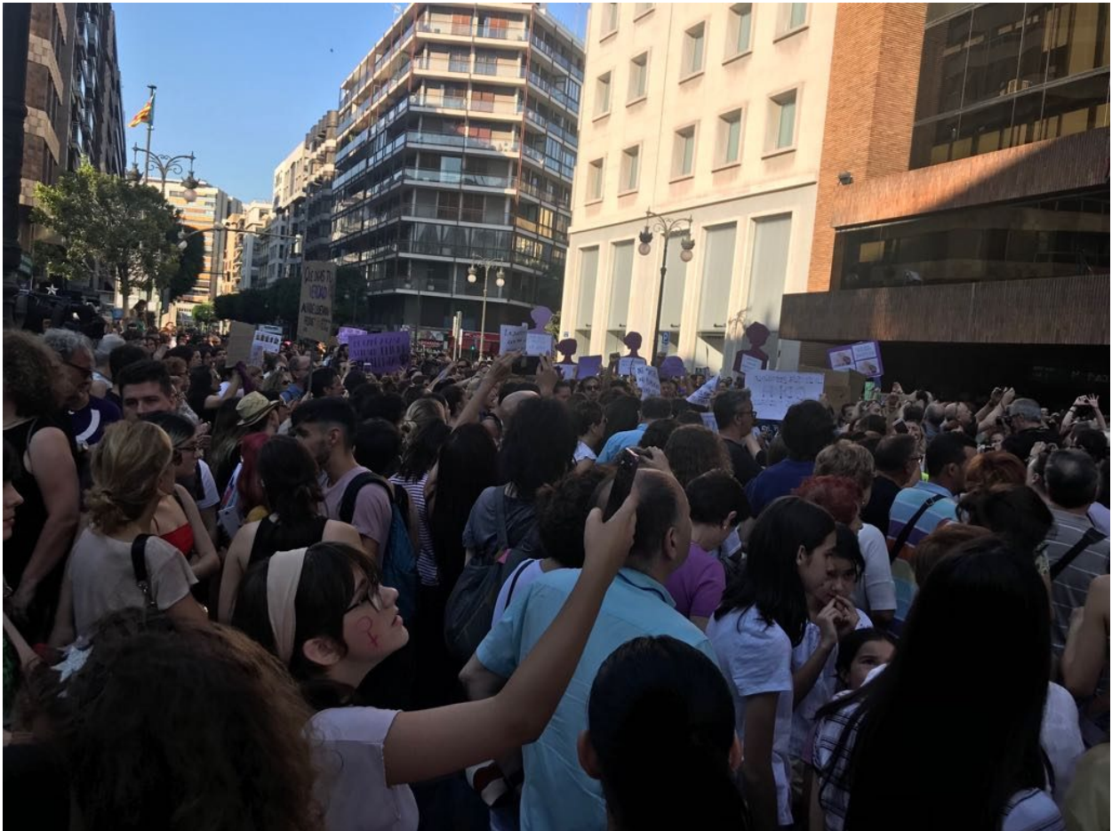
Valencia, 22 de junio 2018

Desde Diario Feminista estamos contribuyendo a difundir esta solidaridad y apoyo a la víctima a contactos internacionales.